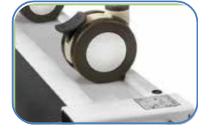
Đẩy giường lên thông qua các đường dốc