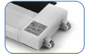
Bánh xe được tích hợp