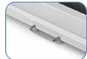
Tay cầm có tính di động