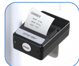
Máy in nhiệt in hồ sơ kết quả để bệnh nhân tham khảo